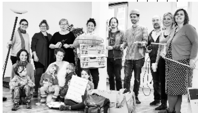
Bildrechte: AlWo1. Luftbild: Stadtberatung Dr. Sven Fries. Vision Kettenhaus: Studio Vlay Streeruwitz, Carla Lo